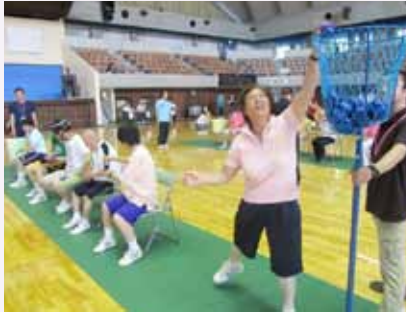
よいしょ！かなりいいペースです。