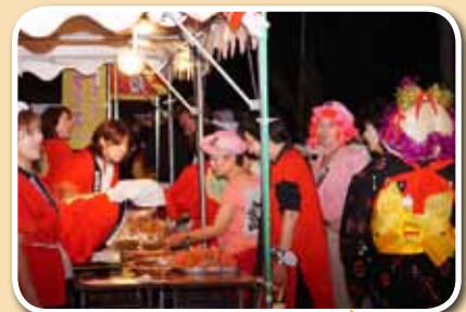
踊りが終わった途端、 露店は大繁盛でてんてこ舞い。