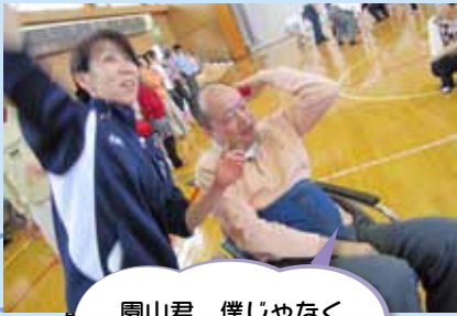
園山君、僕じゃなくカゴをねらって!!