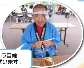
食事前にカメラ目線 ありがとうございます。