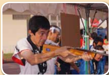
狙いすぎて太鼓の時間に遅れないでね！