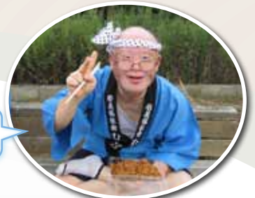
大事な焼きそば うっかり落とさないでくださいね！