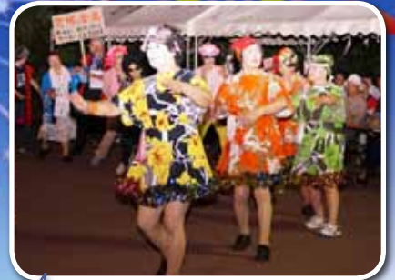
見てください! この華麗な踊りを!!