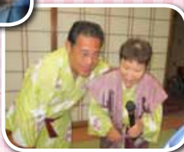
念願のヘルミット