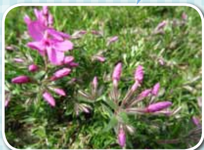
一つ一つはとても小さな花なんです

グループあゆみ は6月18日、男鹿水族館GAOとなまはげ館に行ってきました。なまはげ館は今年はリニューアルされ、明るくなった館内でたくさんのおなまはげを堪能してきました。水族館では世界的に珍しい、とってもかわいい白クマの赤ちゃんに会ってきました。