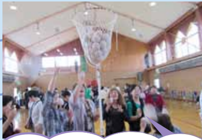
子供の頃に帰ることができましたか？カゴから玉が溢れそう！