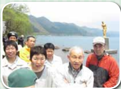
黄金に輝く たつ子姫とともに

グループ高空 は5月22日、横手市大森町の可憐な芝桜で花見を楽しましました。風にそよぐ芝桜に心を癒されました。