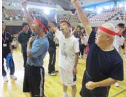
ぜったい勝つぞー オオー!!