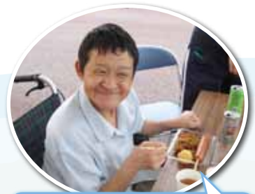
焼きそばにアイス、ジュース…。 テーブルいっぱいですよ！