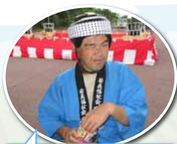
いつもだったら ピースしてくれるのに…。 今日はお菓気に気をとられて…。