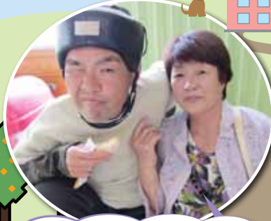
お母さんと一緒だとおいしいね！