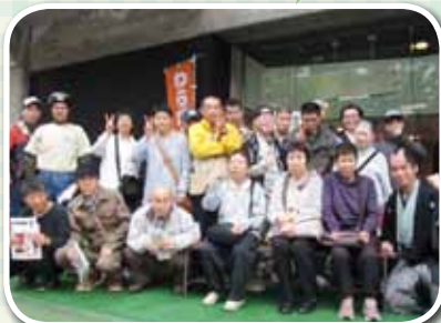
わらび座の俳優さんと記念撮影

現在は苑祭での販売を目標に大根と長ネギの育成に励んでいます。今年も立派な大根、長ネギを提供いたします。