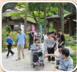
次は、なまはげの実演体験です…。緊張する～