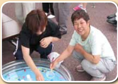
もう、ポイが破れているんですが…。