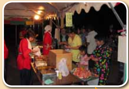
露店には、スイカやアイスが 無料で用意されました。