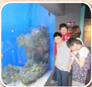
GAOでは色とりどりの魚と出会いました

グループほのほ は一足早く一泊旅行を実施しました。7月2日、3日の両日、岩手県盛岡市方面へ出掛け、サファリパークやさくらんぼ狩りを体験しました。サファリパークでは草食動物への餌やり体験もでき、バスの窓から顔を突っ込んでくるキリンに車内は大騒ぎでした。サクランボ農園では低い枝にさくらんぼの赤い実がびっしりとなっていて、車椅子でも簡単にもぎとることができました。