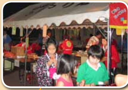
地域を支える子供たち! 来年も来て下さいね!