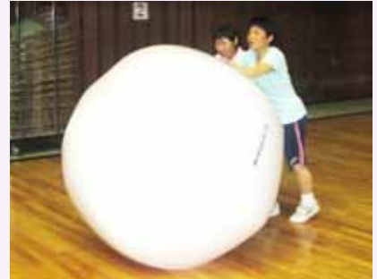
ひまわり苑チーム 大活躍!