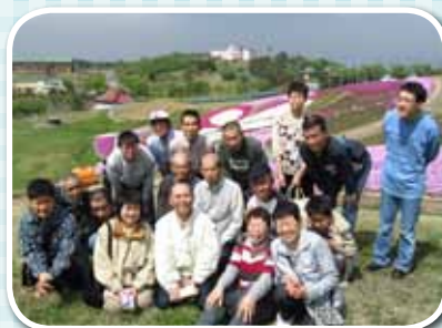
当日は天気にも恵まれ 絶好の花見日和でした

現在はサツマイモの収穫を頑張っています。こちらも苑祭での販売用とあって、傷を付けないよう慎重に収穫しています。