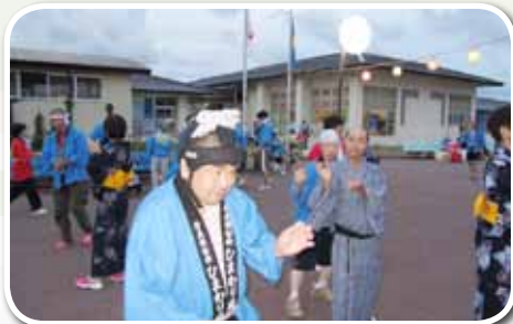
私は 踊れてるわ~ 上手く 踊れてるかな?