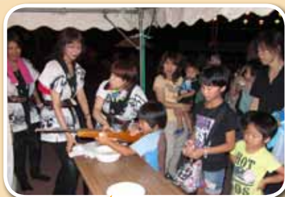
よーく狙ってたくさん 持って帰ってね！