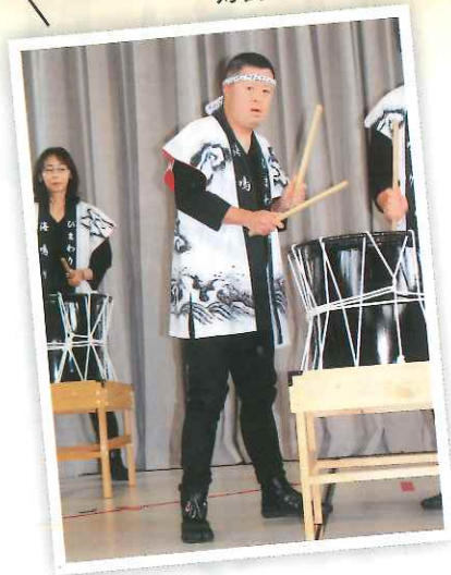
海鳴りの太鼓演奏も好評でした