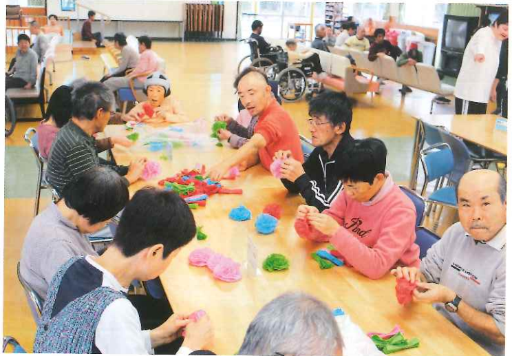
今年も利用者、職員が一丸となって、来苑してくれるお客さんの笑顔を思い浮かべながら、準備に取り掛かりました。