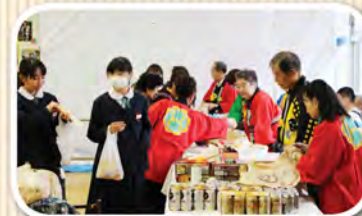
保護者会バナーは今年も大好評 皆さんお疲れさまでした。