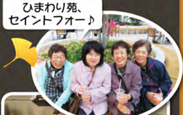
ひまわり苑、セイントフォー♪