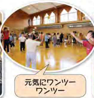
元気にワンツーワンツー