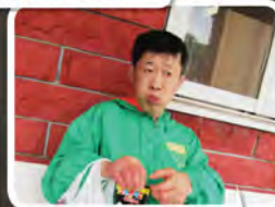
大好きなおやつタイム♪