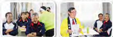
選挙運動の体験談にも大笑い