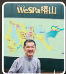
大好きな外出で満面の笑み