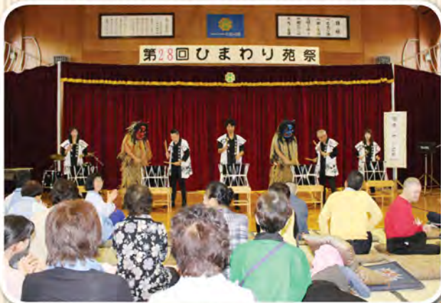
太鼓チーム海鳴りにナマハゲが飛び入り参加! 泣く子も黙る、迫力とパチさばきてした!

午後はゲームコーナー、収穫物販売、露店、保護者会バザーなどが開店し大盛況!特に干本釣りに長蛇の列が出来ておりました。