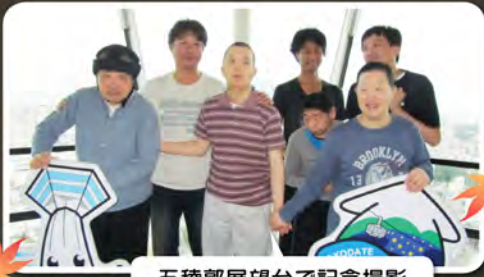
五稜郭展望台で記念撮影