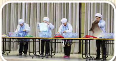
こちらは、裏技でTシャツの早置みにチャレンジ。早く！きれいに！