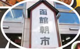
函館朝市に海産物が沢山！