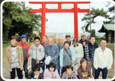
函館の絶景をバックに記念撮影!