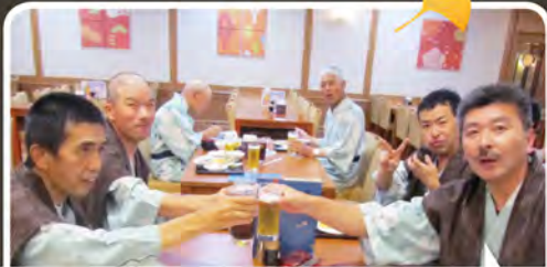
畑作班の皆さん、いつも畑仕事お疲れ様です！乾杯〜♪