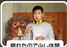
疲れたので少し休憩