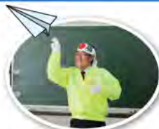
登場！ BGMに合わせてご登場！ 人生は紙ヒコウキ～

健康になる秘訣は、笑うこと・毎日「ニコ」を食べる事・紅茶でうがいをする事だそうです。また、就床時に首は無防備です。首にネックウオーマーをして寝る事により風邪の予防にもなるようです。血液型の特性では、皆さん家族や夫婦間血液型の組み合わせや特徴に思い当たる節があるのか、一番盛り上がった話題でした。今回は福祉から離れた研修内容でしたが、ユーモラスな話術で笑いが絶えずあつという間の時間でした。