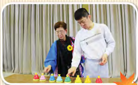
毎日練習していたハンドベルにチャレンジしました。

「ドレミの歌と森のくまさん」に合わせた認知機能班とリハビリ班の楽器演奏は迫力満点でした。