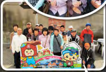
金森赤レンガ倉庫でお買い物!