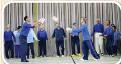
ジャグリングでティッシュ箱のトスにチャレンジ！