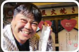
おみくじで大吉！でちやいました〜♪