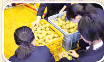
お客さんにはじゃがいも詰め放題に チャレンジして頂きました。