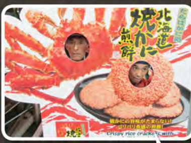
函館朝市で沢山の海産物を、見学(笑)