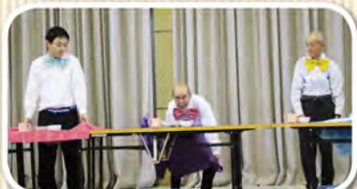
テーブルクロス引きにチャレンジ！食器を倒さず上手に引き抜く事が出来ました！