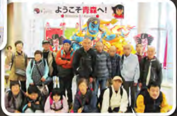
青森県にやってきました☆